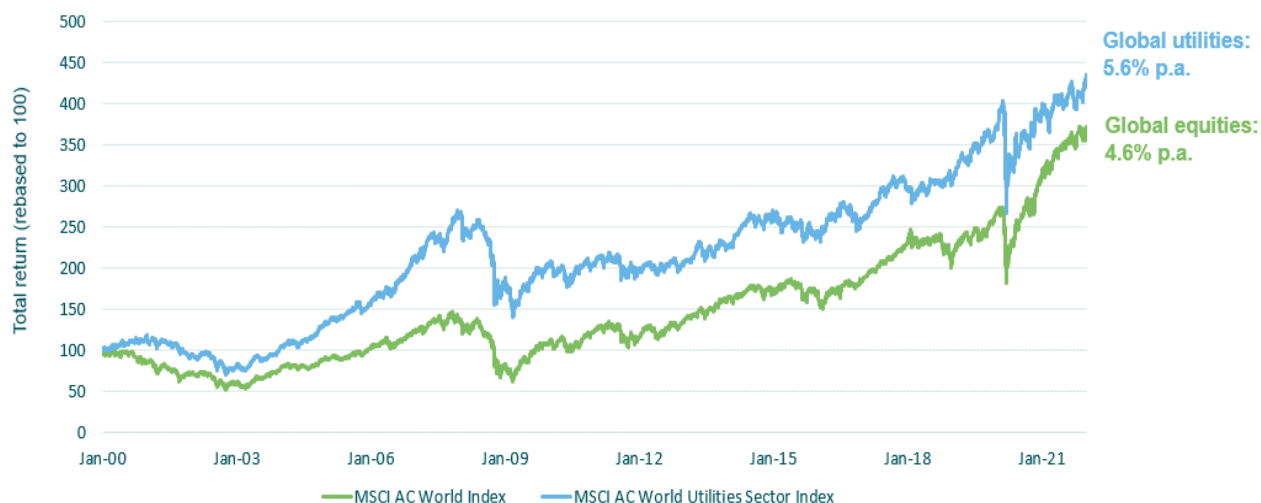
Graphique 1 : indice MSCI ACWI Utilities et indice MSCI ACWI

Les performances passées ne préjugent pas des performances futures.